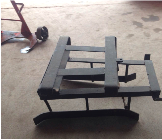
附图 1: 气瓶装载架样式